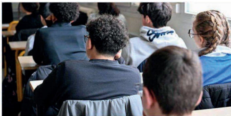
Le rapport du Ceser préconise notamment un « plan de sauvegarde des lycées professionnels à faible effectif », particulièrement nombreux en Bourgogne-Franche-Comté.

« Quels modèles pour les lycées de demain ? », se sont interrogés les conseillers issus de la société civile, qui se sont penchés sur « l'organisation