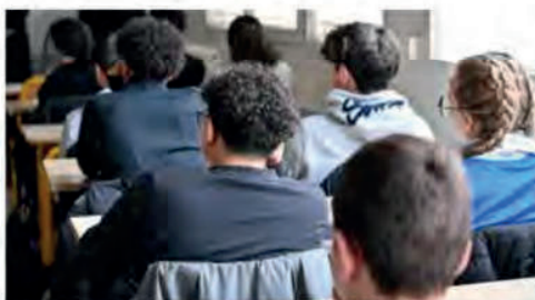
Le rapport du Ceser préconise notamment un « plan de sauvegarde des lycées professionnels à faible effectif », particulièrement nombreux en Bourgogne-Franche-Comté.

De leur travail, les membres de la commission formation et recherche ont tiré quatre grandes orientations se déclinant en douze préconisations.