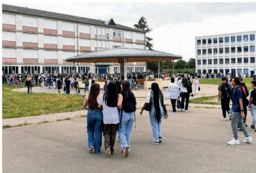
Le Ceser a rédigé un rapport sur les lycées de la région.

Cette donnée de départ n'était pas acquise. La Bourgogne Franche-Comté est plus que d'autres touchée par la baisse démographique. Elle compte, de plus, un grand nombre d'établissements à petits effectifs : environ 380 élèves seulement à Decize et à Toucy, par exemple. Le nombre de lycées publics est important (128) mais, avec la baisse démographique, beaucoup ont déjà des salles voire des bâtiments vacants. La